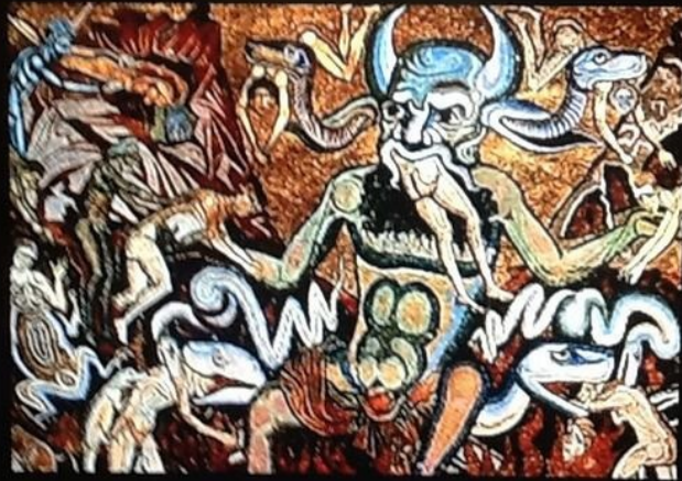
Coppo di Marcovaldo 1260 - 1270