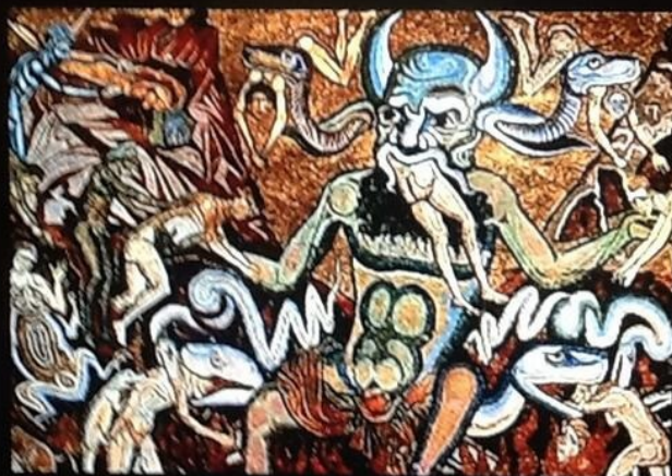
Coppo di Marcovaldo 1260 - 1270